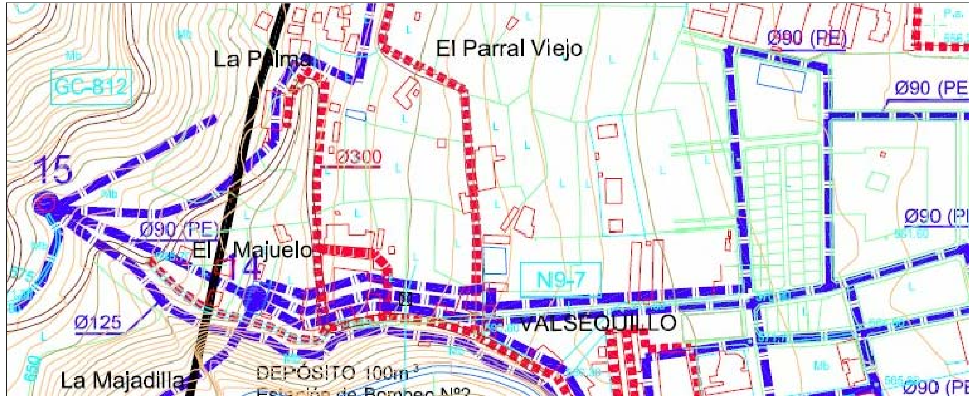
PLAN GENERAL DE ORDENACION - INSTALACIONES URBANAS DE ALCANTARILLADO Y ABASTECIMIENTO DE AGUAS

PLAN PARCIAL SUSNO 4 CASCO OESTE PGO DE VALSEQUILLO